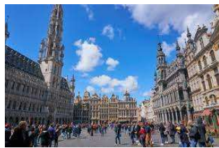
ブリュッセル グラン・プラス