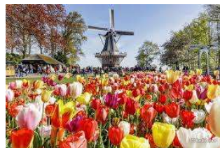
キューケンホフ公園