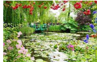
ジヴェルニーのモネの家と庭園