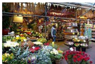
アムステルダム シゲルの花市