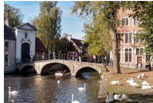
ブルージュ 愛の湖公園